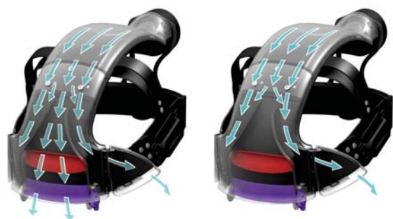
Premier déflecteur (rouge) Contrôle le rapport de l'air sur le front par rapport aux tempes.

Deux déflecteurs d'air permettent aux utilisateurs d'ajuster l'air pour un maximum de confort en évitant le dessèchement des yeux.