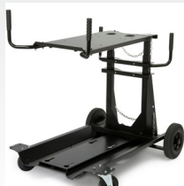
K3059-4 Fahrwagen für Flextec 350X und passende Drahtvorschubköffer