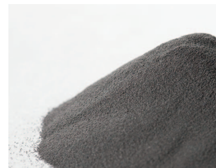
Figuur 1 Enkele grondstoffen die gebruikt worden voor de productie van beklede elektroden en gevulde draden. Van boven naar onder: bauxiet, chroom ijzer.